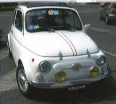
Marone Ennio - Socio n° 1429