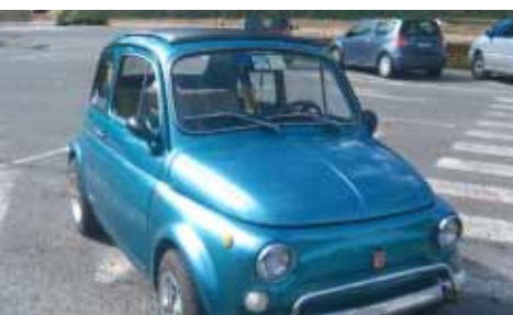
D'Andria Pasquale - Socio n° 670