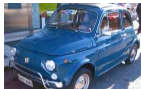
Litardi Maurizio - Socio n° 1468