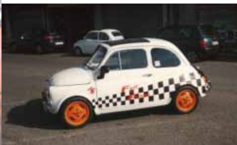
Maurizio Cancanelli - Socio n° 407