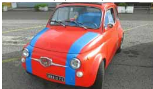
Ferrino Toppi - Socio n° 1830