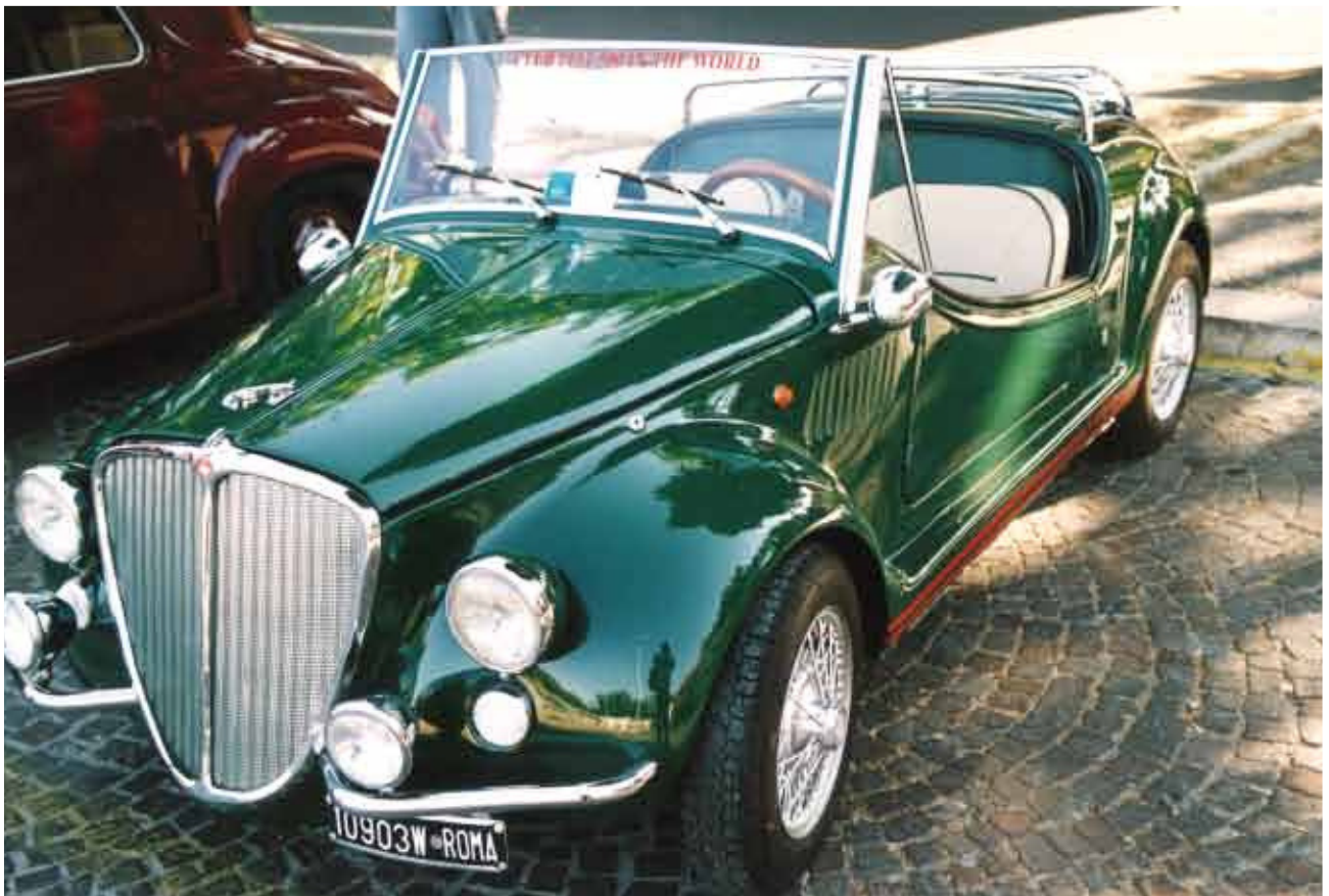
Pieri Mario - Socio n° 1