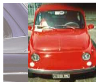
Volponi Massimo - Socio n°230