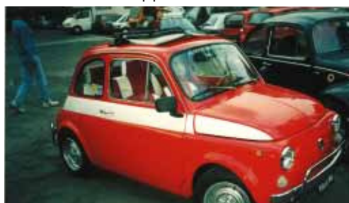
Alessia Pagliari - Socio n° 362