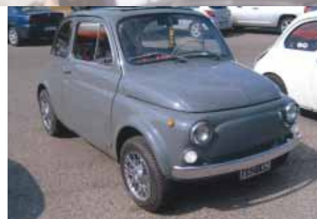
Patrizi Giuseppe - Socio n° 1596